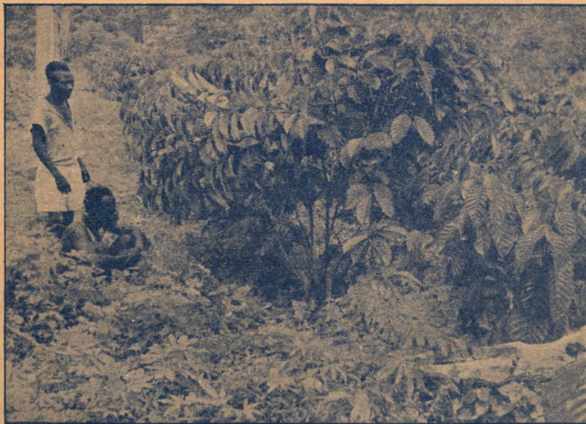
Jeunes caféiers après arcure partielle. Plusieurs tiges ont été dirigées vers l'espace dégagé, afin de ne pas encombrer à l'excès l'intérieur des lignes couplées.